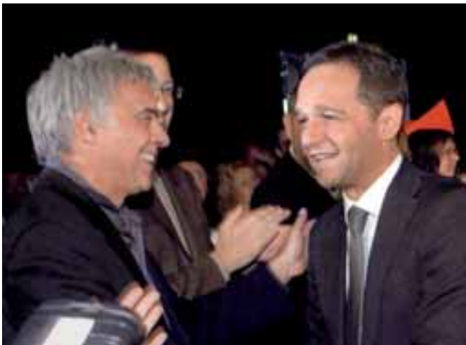
Heiko Maas wurde begeistert empfangen.

Furioser Wahlkampfauftakt der SPD im Dillinger Loksuppen: Mit überwältigenden 96,6 Prozent der Delegiertenstimmen hat die SPD Saar Heiko Maas als Spitzenkandidat für die Landtagswahl gewählt. In einer kämpferischen und viel umjubelten Rede hatte sich Maas zuvor für einen grundlegenden Wechsel im Saarland ausgesprochen. Maas betonte, die Menschen an der Saar wollten den Wechsel – diesen biete die SPD Saar mit klaren Alternativen in der Wirtschafts-, Struktur- und Bildungspolitik