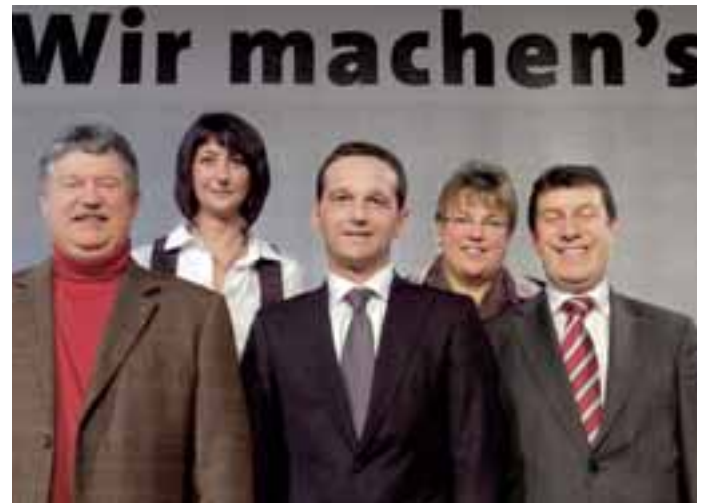
Geschafft: Die Landesliste ist aufgestellt.